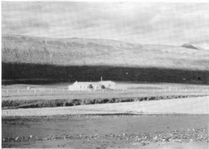
Nesoddi í Miðdölum um 1960.